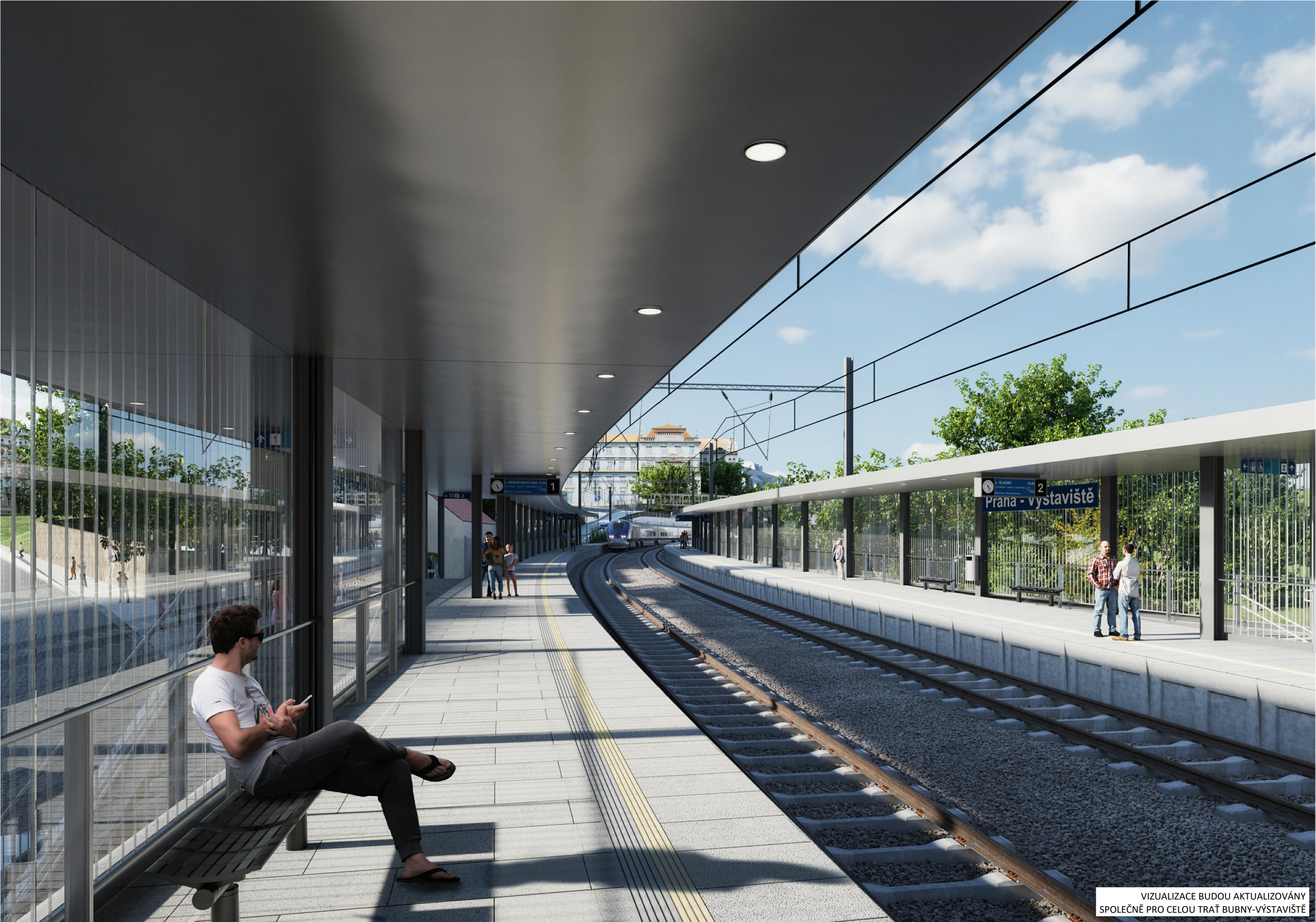
VIZUALIZACE BUDOU AKTUALIZOVÁNY SPOLEČNĚ PRO CELOU TRÁŤ BUBNY-VÝSTAVIŠTĚ